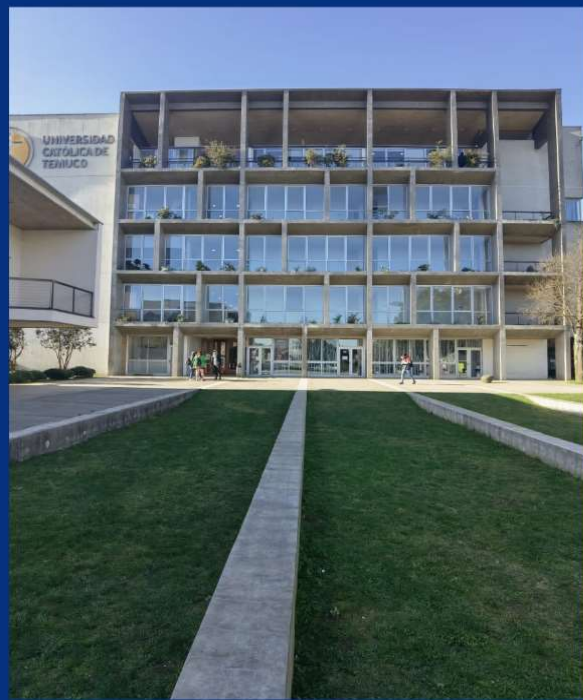
Campus Juan Pablo II Edificio Ricardo Ferrando Oficina 501